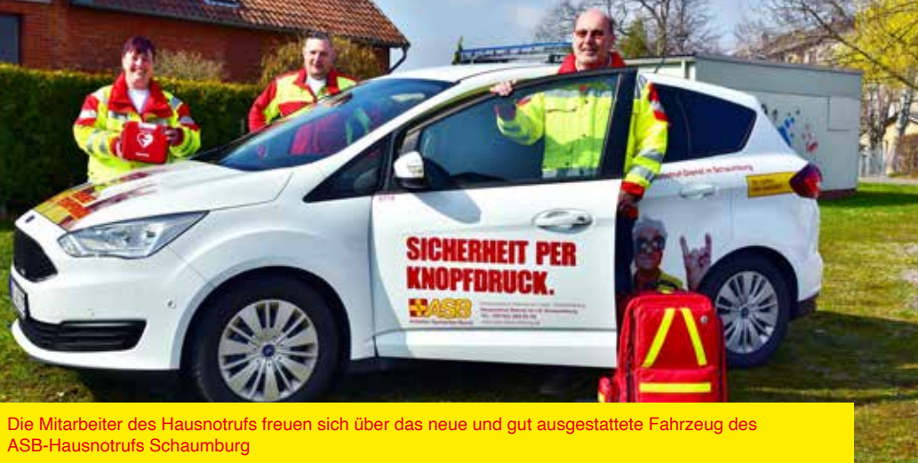
Die Mitarbeiter des Hausnotrufs freuen sich über das neue und gut ausgestattete Fahrzeug des ASB-Hausnotrufs Schaumburg