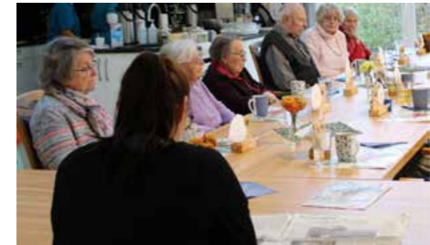
Die morgendliche Zeitungsrunde gehört in unseren Tagespflegen täglich zum Start in den Tag.