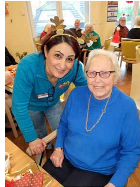
In unseren Einrichtungen werden die Gäste liebevoll umsorgt.