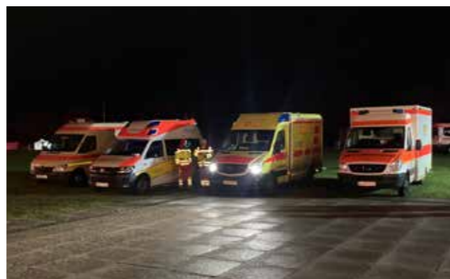
Am Olympiastadion in Berlin