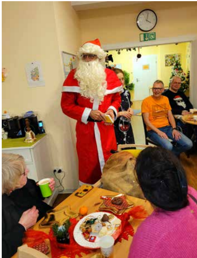
Selbst der Weihnachtsmann hat unsere Tagespflege Ronnenberg besucht.