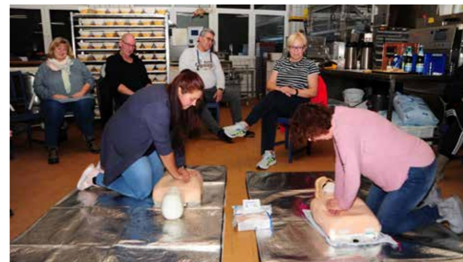
Ungewhnlicher Ausbildungsort: 25 Mitarbeiterinnen und Mitarbeiter der Bckerei Hnerberg wurden in der betriebseigenen Backstube in Erster Hilfe unterrichtet.