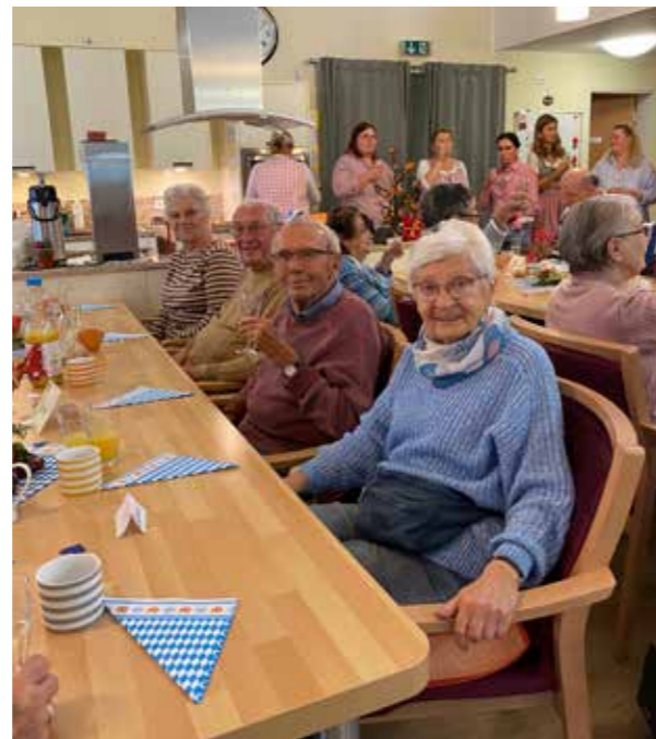
Gesellige Feiern mit Angehörigen sind sehr beliebt.