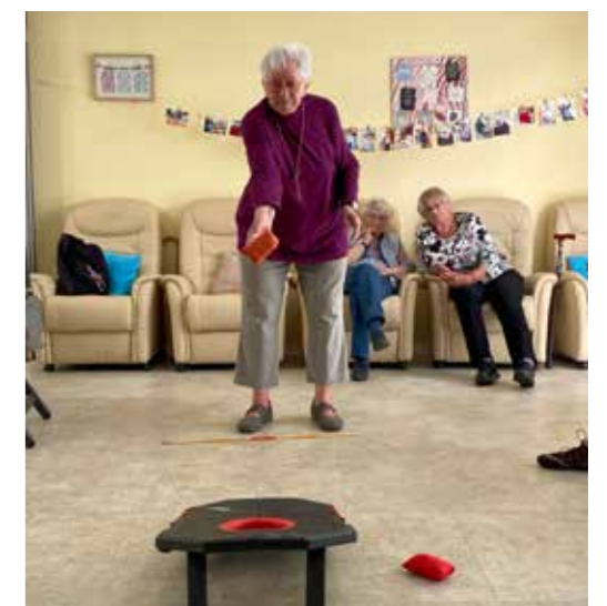
Spa an der Bewegung kennt kein Alter.