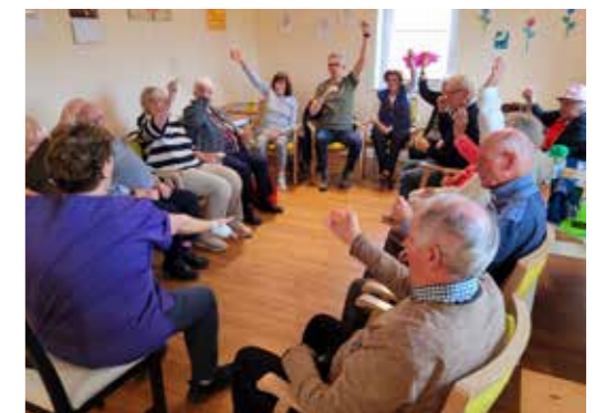
Gemeinsam statt einsam: Unsere Gste singen und spielen gerne.