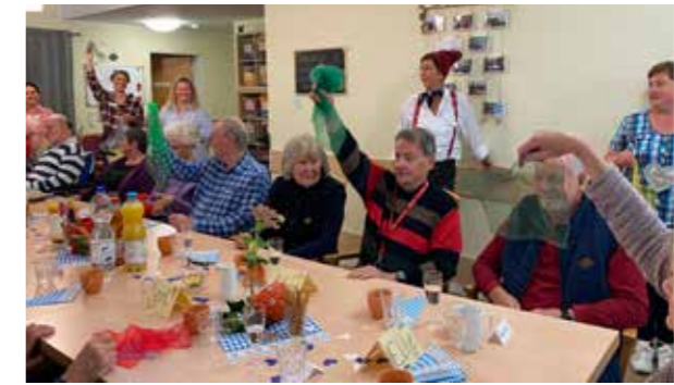
Mit lustigen Spielen ist der Besuch unserer Tagespflegen immer abwechslungsreich.