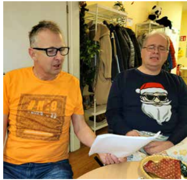
Zu Weihnachten wird natürlich auch gesungen.