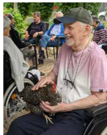
Besonderer Besuch: Manchmal sind auch Hühner zu Gast und unterhalten unsere Gäste.