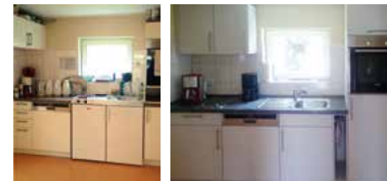
Alt und neu: So sah die Küche vorher aus – und so jetzt

„Die Räume werden von einem ganz gemischten Publikum besucht“, berichtet Rovira. „Viele kurdische und arabische Familien kommen, Menschen aus Peru und Spanien, aber auch viele Deutsche. Trotz der unterschiedlichen Kulturen und Nationalitäten geht es hier immer sehr offen, friedlich und freundlich zu – die Stimmung ist einfach familiär.“ Die Angebote sind vielfältig: Geboten wird unter anderem an jedem ersten Donnerstag im Monat ein Frauenfrühstück. Jeden dritten Dienstag im Monat bittet der Internationale Kulturverein zu einem „Abend der Begegnung“, bei dem Spiele auf dem Programm stehen. Zudem werden die Besucher des Stadtteiltreffs zu Bastelnachmittagen, Deutsch- und Arabischstunden, zu Sportkursen und