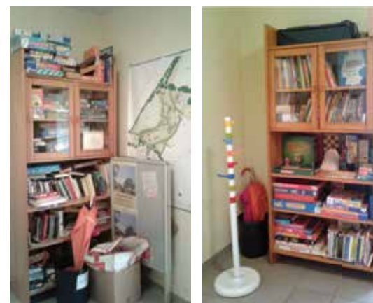
Alt und neu: So sah die Bücherecke vorher aus – und so jetzt

Erst einmal plant und organisiert das ASB-Team jetzt aber zunächst ein kunterbuntes Stadtteilstfest mit vielen Aktivitäten. Das steigt am Sonnabend, 2. September, und gibt vielen Vereinen und Organisationen, aber auch beispielsweise der Polizei die Möglichkeit, sich den Anwohnern vorzustellen.